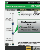
OptiFiber® Pro EventMap