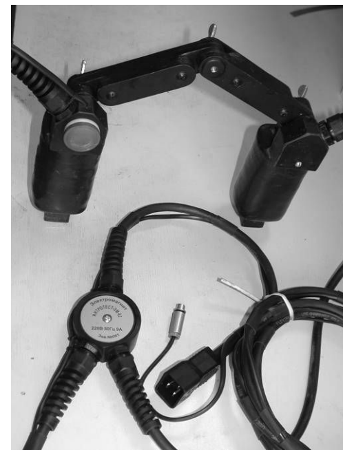
Рис.1 – внешний вид электромагнита

Кабель питания электромагнита соединен с катушками неразъемно. Электромагнит подключается к питанию по схеме с третьим заземляющим проводником. Сердечники электромагнита электрически соединены с заземляющим проводом кабеля питания.