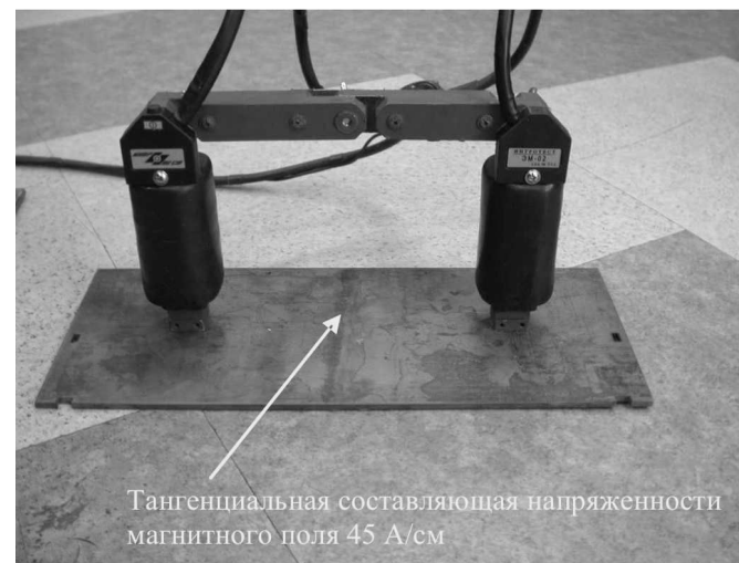
Рис.1 Намагничивание поверхностей простой формы электромагнитом с соединенными сердечниками