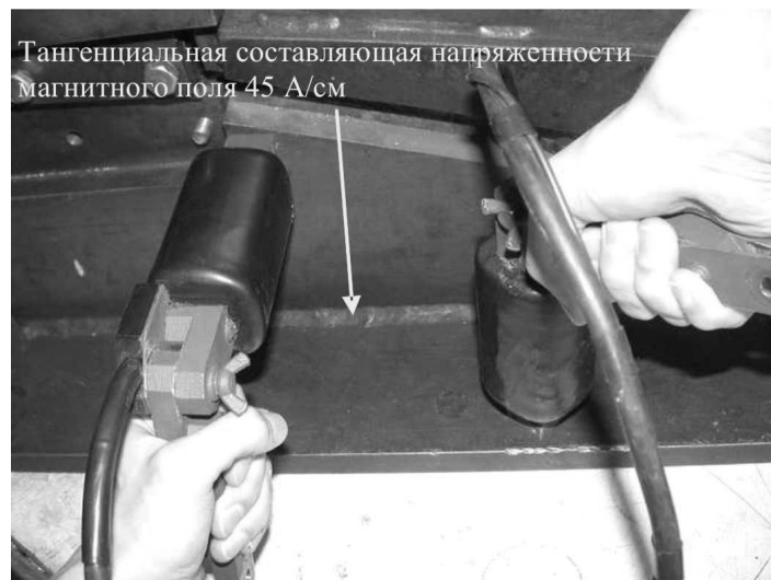
Рис.4 Намагничивание углового сварного шва электромагнитом с разъединенными сердечниками