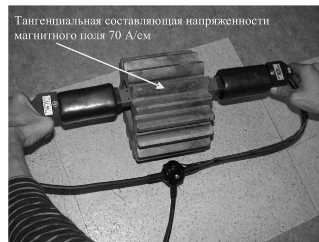
Рис.2 Намагничивание отдельных зубьев шестерни электромагнитом с разъединенными сердечниками