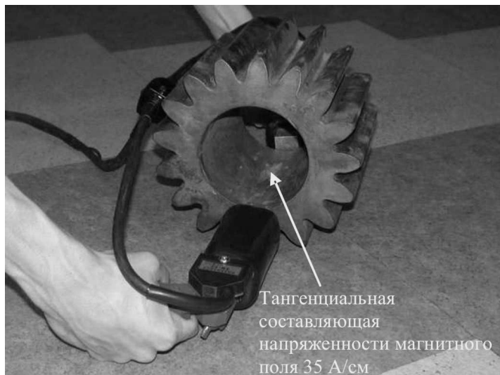
Рис.3 Намагничивание внутренней поверхности шестерни электромагнитом с разъединенными сердечниками