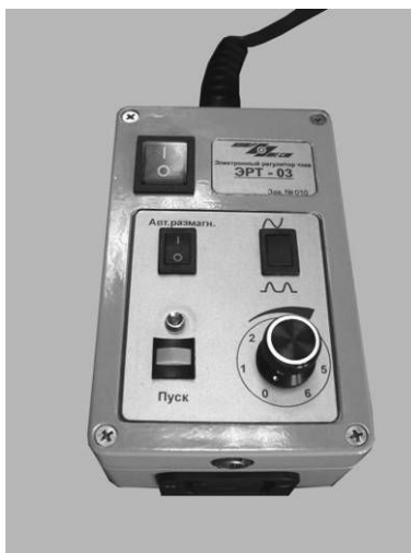
Рис.2 – внешний вид электронного регулятора тока ЭРТ-03

Электронный регулятор тока позволяет плавно управлять током электромагнита путем регулирования угла запуска симистора. Помимо режима намагничивания переменным током предусмотрен режим однополупериодного выпрямленного тока для более глубокого намагничивания деталей.