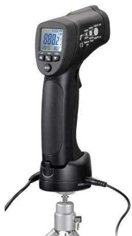
Рис.7. Пирометры инфракрасные моделей DT-8855, DT-8856