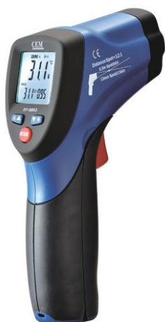
Рис.8. Пирометры инфракрасные моделей DT-8862, DT-8862B, DT-8863, DT-8863B, DT-8865