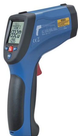
Рис.9. Пирометры инфракрасные моделей DT-8867H, DT-8868, DT-8868H, DT-8869, DT-8869H, DT-8878, DT-8879, DT-8889, DT-8889H