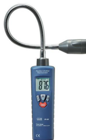
Рис.12. Пирометры инфракрасные модели IR-68