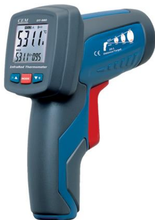
Рис.3. Пирометры инфракрасные моделей DT-980, DT-981, DT-982