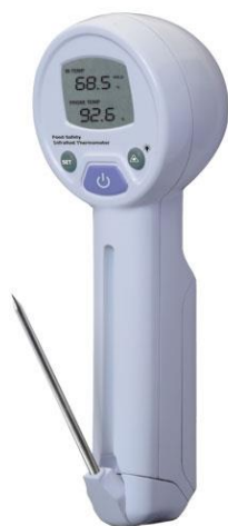
Рис.15. Пирометры инфракрасные модели IR-97