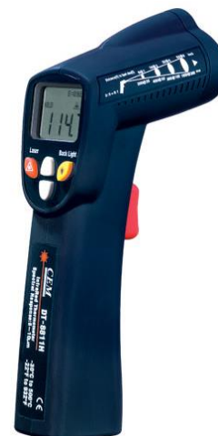
Рис.4. Пирометры инфракрасные моделей DT-8810, DT-8811, DT-8812, DT-8810H, DT-8811H, DT-8812H