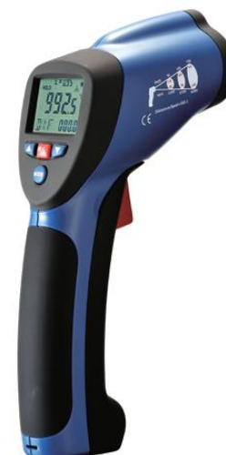
Рис.5. Пирометры инфракрасные моделей DT-8818, DT-8818H, DT-8819, DT-8819H, DT-8826H, DT-8828, DT-8828H, DT-8829, DT-8838, DT-8839, DT-8858, DT-8859, DT-8859H