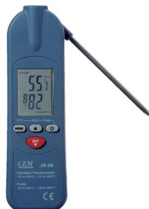
Рис.16. Пирометры инфракрасные модели IR-98