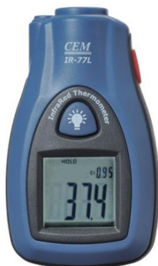
Рис.13. Пирометры инфракрасные моделей IR-77L, IR-77H