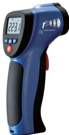
Рис.2. Пирометры инфракрасные моделей DT-880, DT-880H, DT-882, DT-882H, DT-883, DT-883H, DT-8801, DT-8802