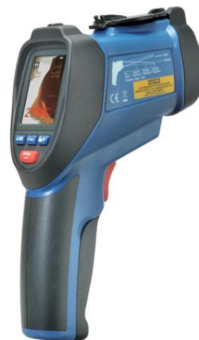
Рис.10. Пирометры инфракрасные моделей DT-9860, DT-9861, DT-9862, DT-9863, DT-9865