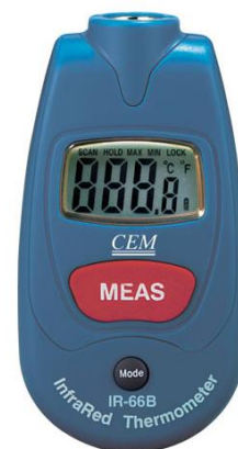
Рис.11. Пирометры инфракрасные моделей IR-66, IR-66B