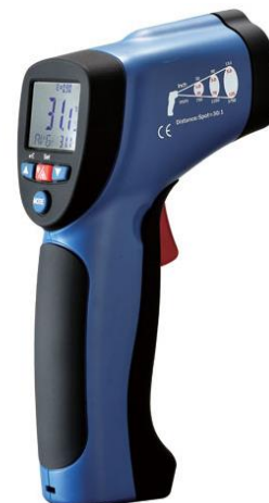
Рис.6. Пирометры инфракрасные моделей DT-8830, DT-8833, DT-8833H, DT-8835