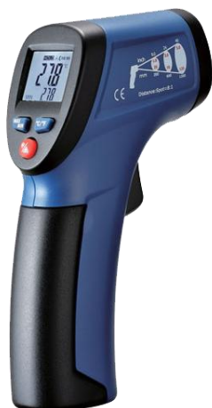
Рис.1. Пирометры инфракрасные моделей DT-810, DT-811, DT-812