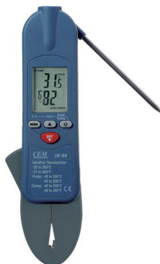
Рис.17. Пирометры инфракрасные модели IR-99