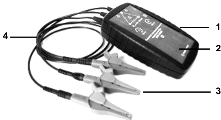
Рисунок 1.4.1 - Внешний вид указателя

1.4.1 Внешний вид указателя изображен на рисунке 1.4.1.